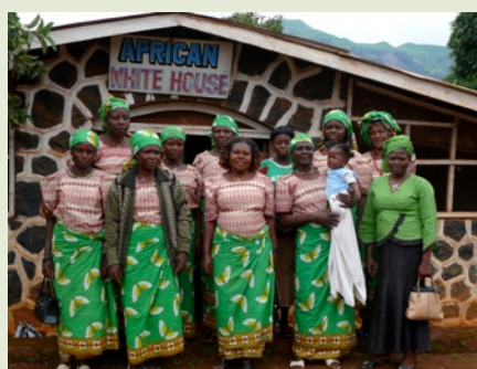
El grupo "Lovely Mothers" en Jinkfuin. Realizan tareas de forma conjunta para mejorar su economía y la de su familia.

Ante nada queremos dar las gracias por vuestro interés, las reacciones recibidas, las ofertas de colaboración y los ánimos. Tenemos los primeros socios, varias peticiones para apadrinar, ofertas de voluntarios ( algunos con ganas de pasar una temporada en Camerún ) y un grupo de bicifricanos recogiendo bicicletas por Madrid. Nuestro lema " juntos sí es posible " se ha re-afirmado después de todos el interés por vuestra parte. Muchos granitos de arena llegarán a ser algo importante al final. Queremos que las personas con interés se sientan parte del proyecto y vivan la experiencia. Muchos habéis indicado querer ayudar pero no sabéis muy bien cómo. No queremos decir qué es lo que ha de hacer cada uno pero si podemos facilitar algunas