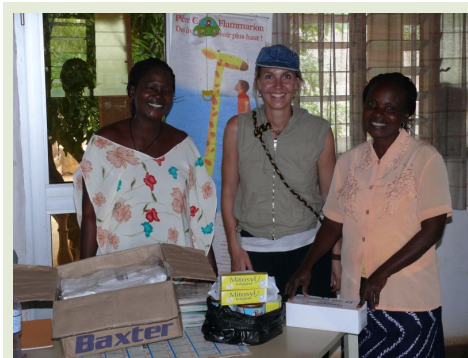
Entregando medicamentos, mosquiteras y leche en polvo en el centro de nutrición

Existen muchos retos y hay que mirar más allá, ejecutar una rigurosa investigación con todos los stakeholders antes de preparar un